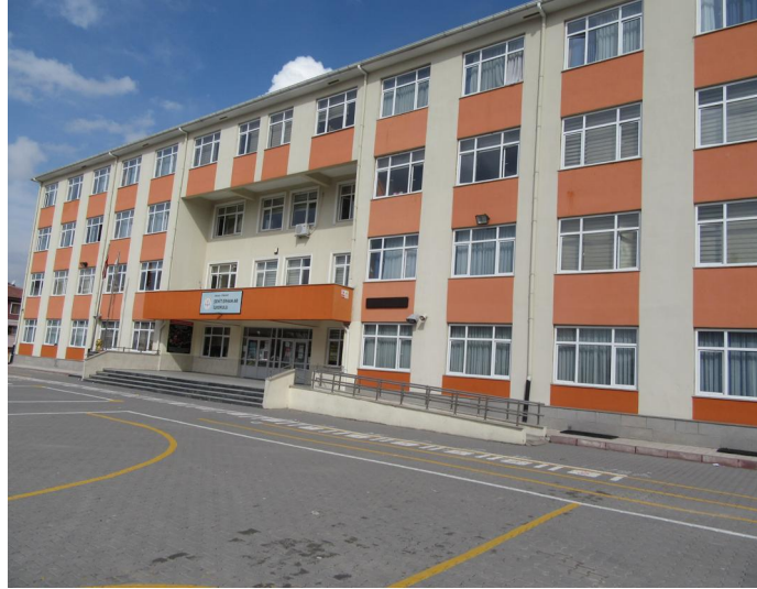
Şekil 3: Şehit Erhan Ar İlkokulu

Açıklama [F12]: (Okulun kısa tanıtımı bölümünde veli, öğrenci, öğretmen ve diğer paydaşlar için önemli olan hususlar ile faaliyetlere ilişkin kısa bir bilgilendirme yapılması beklenmektedir. Alınan ödüller, başarılar, başarılı ve farklı uygulamalara yer verebileceğiniz tanıtım bölümünün iki, üç sayfadan fazla olmamasına dikkat edilmesi gerekmektedir.)