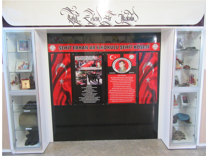
Şekil 4: Şehit Jandarma Komando Uzman Çavuş Erhan Ar

Okulumuz adını 17.08.2011 yılında Hakkari İli Çukurca ilçesinde bölücü terör örgütü tarafından yola döşenen mayının patlatılması sonucu şehit olan Jandarma Uzman Çavuş olan Erhan Ar isimli askerimizden almıştır.